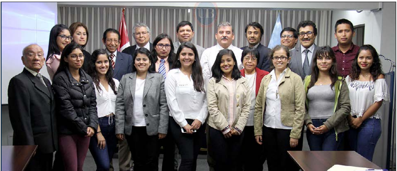
El grupo de investigación de la UB que tuvo a su cargo la presentación de los proyectos.

Avances fueron presentados por profesores y alumnos en la Jornada Académica